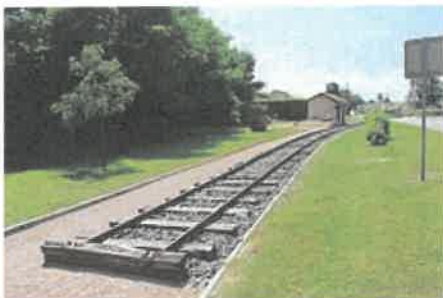
Ancienne voie ferrée près de l'ancienne gare.

L'autoroute A6 est une voie passant à moins de 10 kilomètres de la commune et relie Paris à Lyon. Elle est accessible depuis l'A406 pour aller à Lyon et par l'A40 pour se rendre à Paris. Dernièrement, l'autoroute A406 est une autoroute reliant l'A40 et l'A6, elle permet aux usagers de gagner un quart d'heure pour aller à Mâcon Sud en évitant le centre. Afin d'accéder au contournement de Mâcon, il suffit de se rendre à la gare de péage de Crotchet à 7 kilomètres au sud-ouest. Cette autoroute permet d'accéder à l'A6 en direction de Lyon.