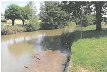
La Grande Loëze à la frontière avec Bâgé-le-Châtel.